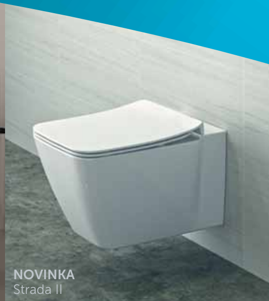
NOVINKA Strada II

TECHNOLOGIE SPLACHOVÁNÍ AQUABLADE® ZÍSKALA ŘADU OCENĚNÍ ZA DESIGN A INOVACI